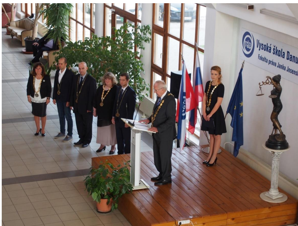
Vedenie VŠD – rektor, prorektorka, dekanica a prodekanovia fakúlt