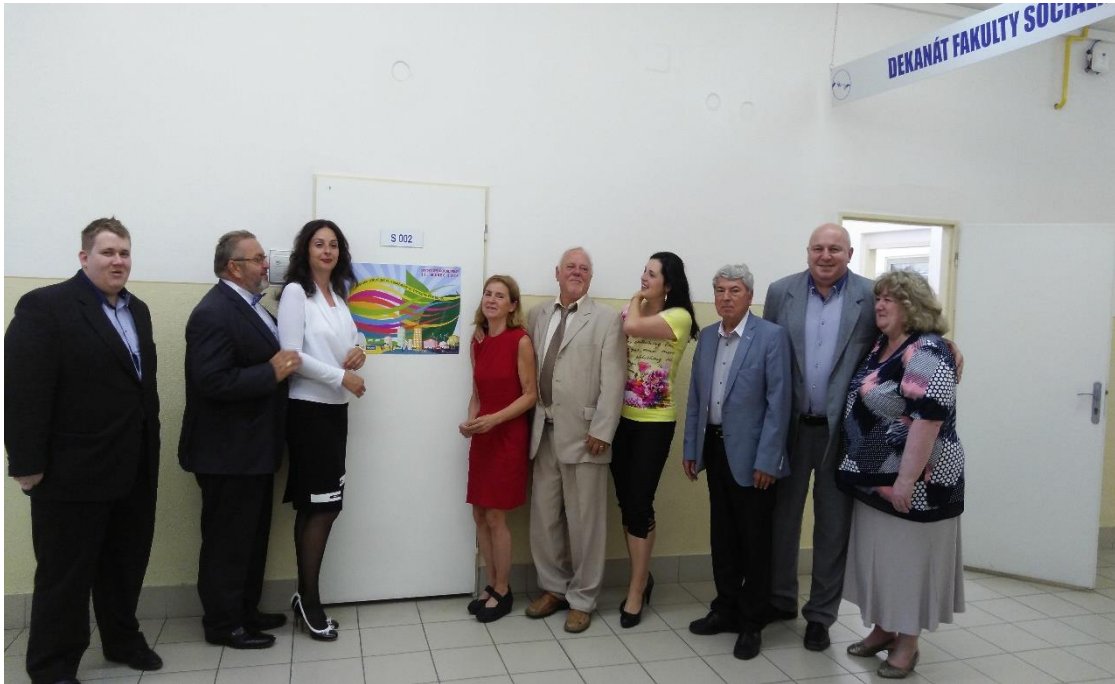
Organizátori podujatia Svetového dňa sociálnej práce III. ročník